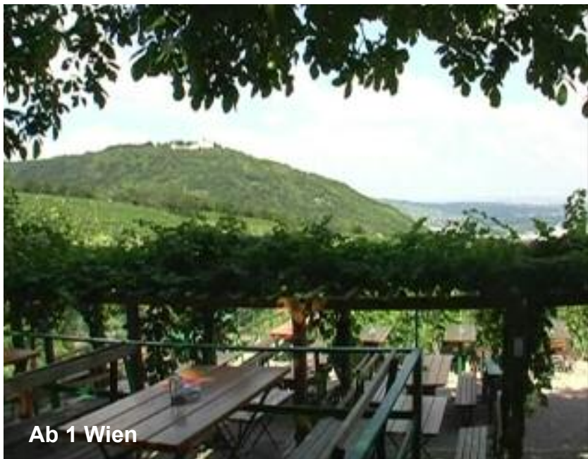
Ab 1 Wien